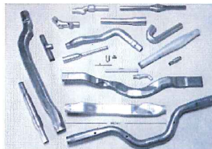
ハイドロフォーミングマシン ECO2500H ECO-2500H